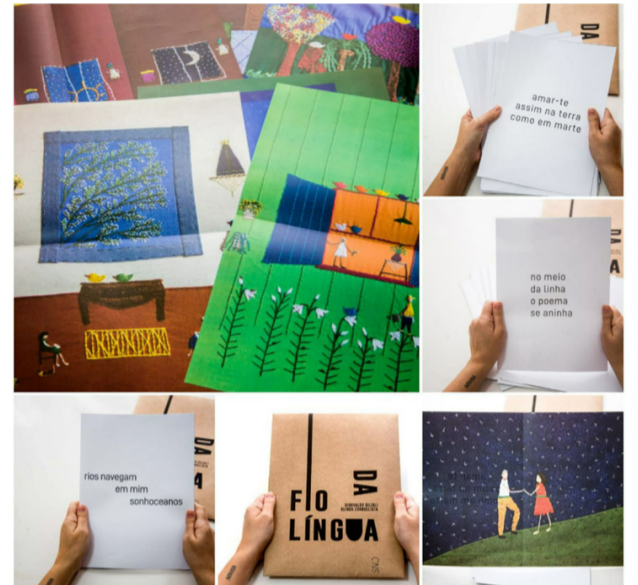
Crédito: Cais Editora

Formato: Livro-cartaz com bordados, poesia e apresentação visual. O projeto, que mistura literatura e artes visuais, é descrito como uma experiência tátil, com poemas que podem ser expostos como cartazes.