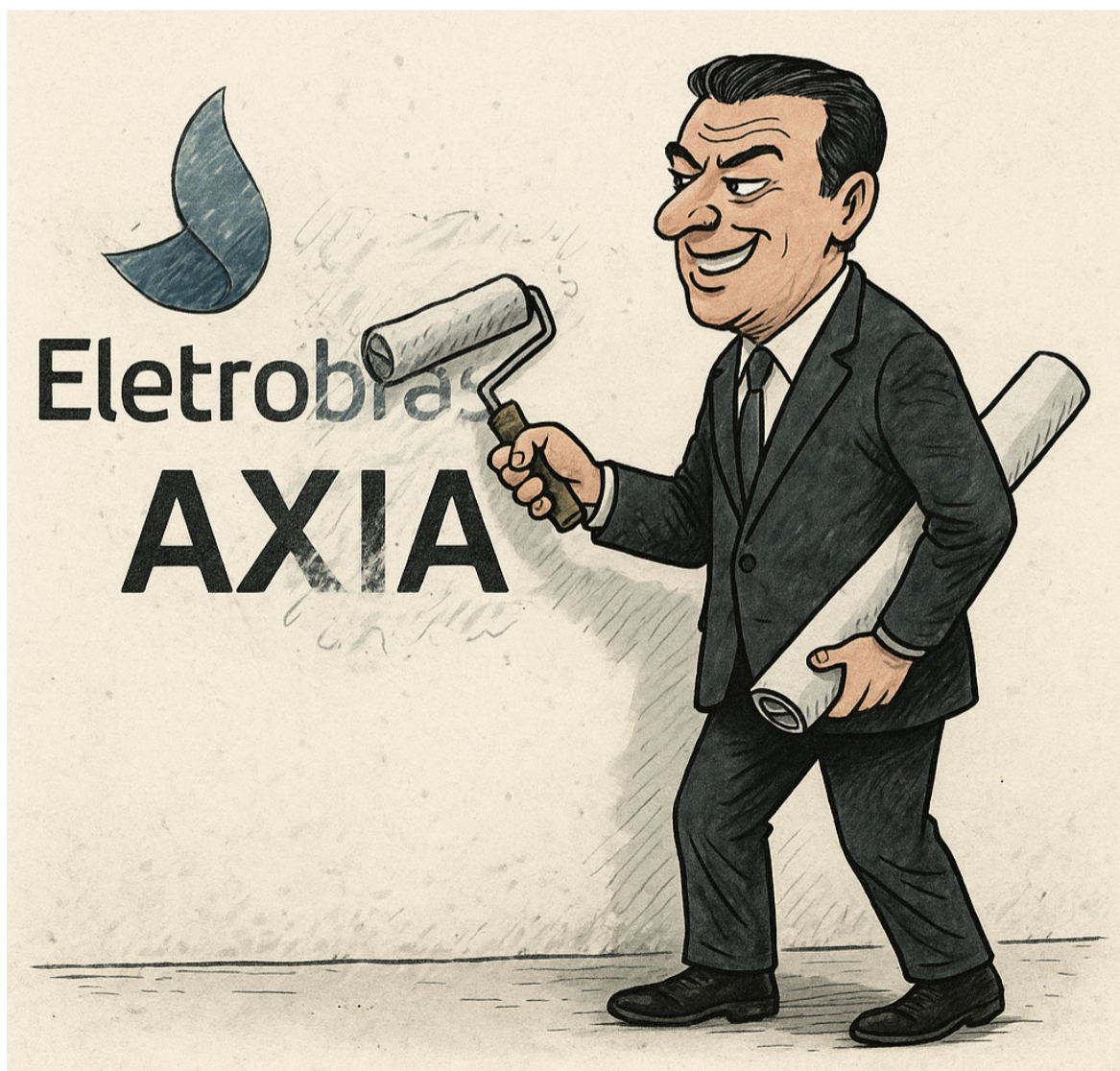
Imagem criada por IA

A reestatização não é apenas uma pauta econômica, é um projeto de Brasil, de futuro e de respeito ao que foi construído coletivamente pelo povo brasileiro. Para a Intersul, a mudança do nome é simbólica e representa o apagamento da memória de um