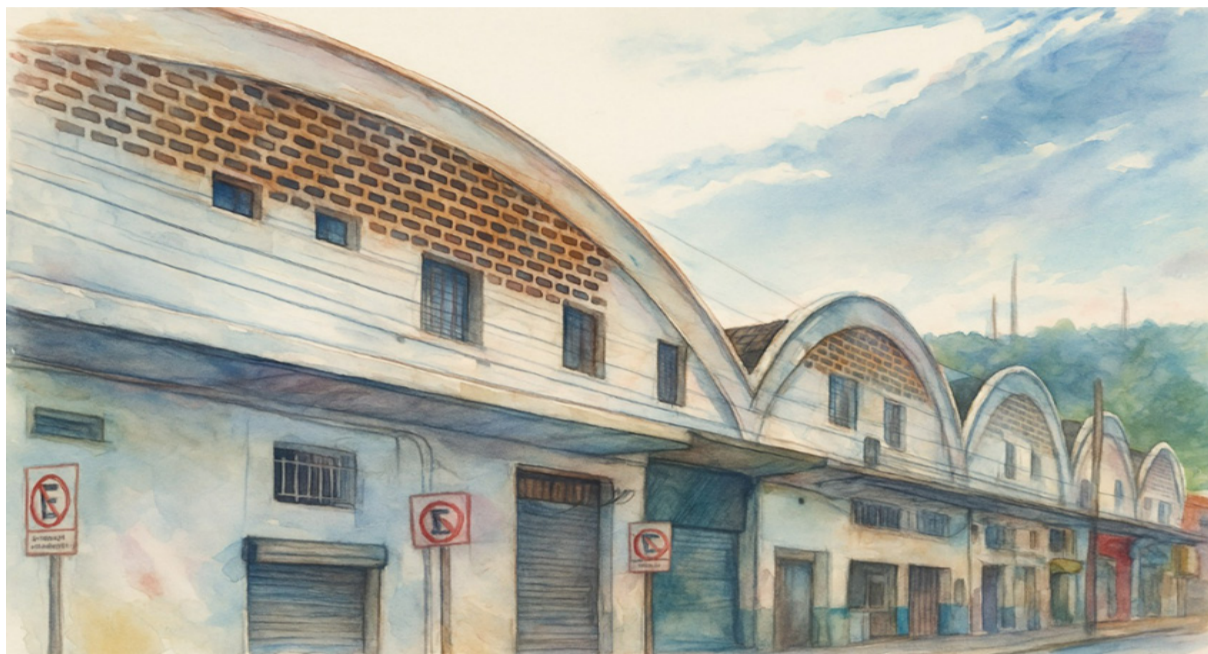
Arte: Adriana Schmidt

Por que não permitir que um prédio com tantas histórias vire pó