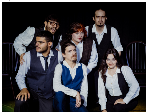
Cia Clandestinos promove oficina gratuita de improviso em Florianópolis

As ações da companhia, formada por artistas engajados na pesquisa e criação artística voltada ao Teatro de Improvisação, têm como alicerce a investigação prática e teórica da linguagem do improviso, buscando uma poética própria que valorize o processo criativo fundamentado na pesquisa contínua e no aprofundamento da dramaturgia improvisada.