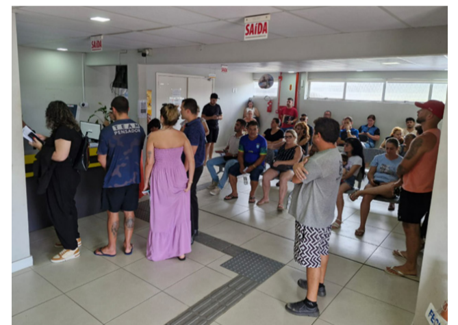
Movimento nas lojas entre os dias 20 e 21 de janeiro de 2025