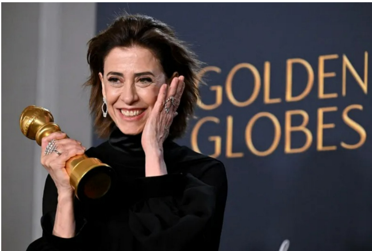
Fernanda Torres, emocionada, dedica o Globo de Ouro à sua mãe, a atriz Fernanda Montenegro, que concorreu a mesma premiação há 25 anos.

Atriz fez história por conta de sua atuação em filme que retrata a luta pelos direitos civis durante a ditadura, superando personalidades conhecidas mundialmente