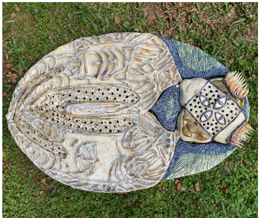
Trabalho da artista Camila Martins que integra a nova exposição da Fundação Cultural Badesc. Crédito: Camila Martins