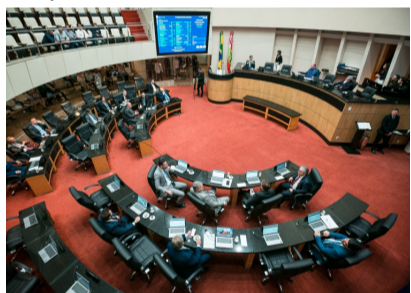
Plenário da Alesc

Isso traz uma consequência do modelo de privatização, que essa empresa que presta o serviço tem o compromisso com o lucro e não o compromisso de entregar um serviço de qualidade ”. Marquito chamou outros parlamentares para o debate: “Quero principalmente trazer para esse parlamento, que tem uma tarefa fundamental, que é defender a Celesc enquanto instituição pública : nós passamos por um ciclone bomba em 2020, uma das maiores catástrofes em Santa Catarina, e a Celesc conseguiu recuperar em menos de 3 dias 100% das ligações de energia elétrica. A Celesc, por ser pública, garante em dos serviços mais baratos de distribuição de energia elétrica e precisamos compreender que o caminho é a manutenção da Celesc Pública, ampliar o quadro de trabalhadores e, principalmente, dar condições de trabalho adequadas com equipamentos e pessoal”.