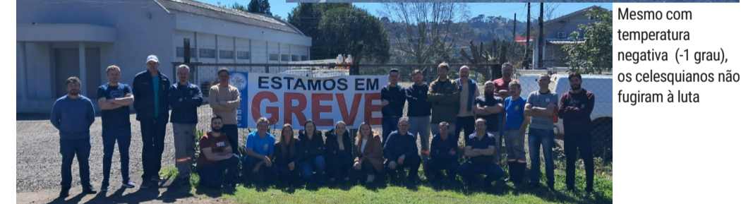
Mesmo com temperatura negativa (-1 grau), os celesquianos não fugiram à luta