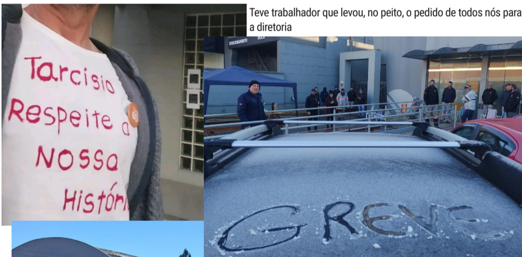
Teve trabalhador que levou, no peito, o pedido de todos nós para a diretoria