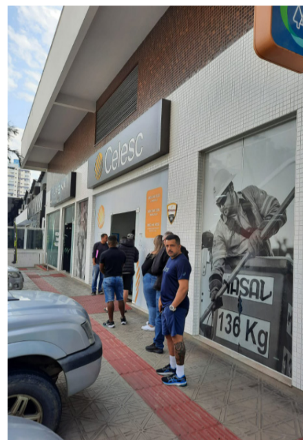
Consumidores fazem fila para atendimento em frente à loja da Celesc na Grande Florianópolis. Foto tirada em 08/08/2024

Relatório final - com dados e respostas anônimas - foi juntado à denúncia da Intercel no Ministério Público do Trabalho e encaminhado para conhecimento da Celesc