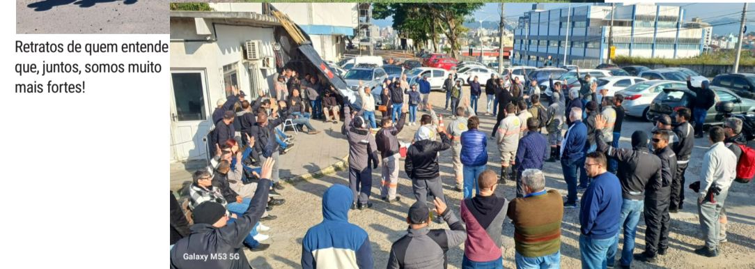
Retratos de quem entende que, juntos, somos muito mais fortes!