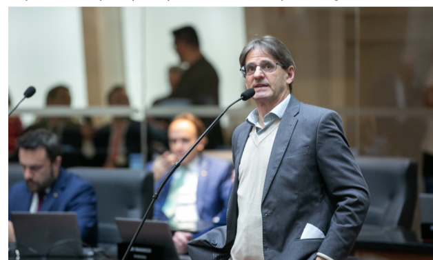
Deputado Neodi Saretta (PT).