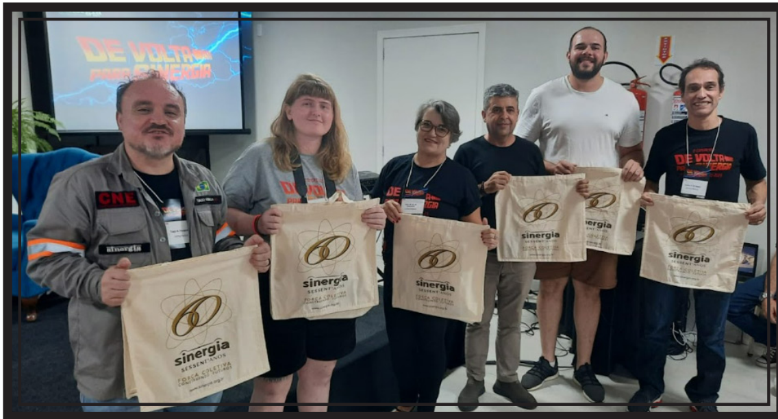
Participantes que venceram o Concurso e tiveram fotos selecionadas para o calendário 2024 do Sinergia

O Sinergia agradece às eletricitárias, eletricitários, seus familiares e à Comissão selecionadora pela participação. Acompanhe as redes sociais do Sinergia para saber a data e aproveitar a exposição das fotografias na empresa em que trabalha.