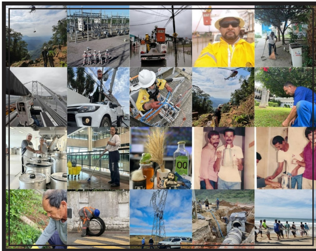
Fotos vencedoras da segunda edição do Concurso FotoGrafando a Trabalhadora e o Trabalhador